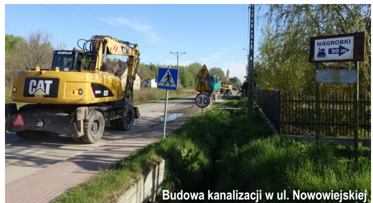
Budowa kanalizacji w ul. Nowowiejskiej