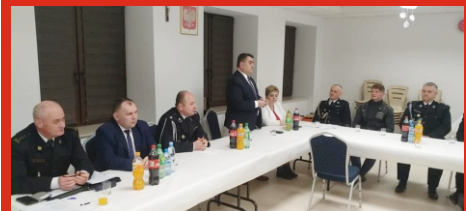
Walne zebranie sprawozdawcze jednostki OSP Łochów Fabryczny. Marzec 2020 r.