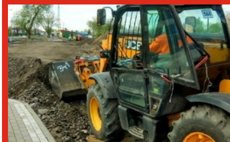
Budowa parkingu „Parkuj i Jedź”. Łochów - maj 2020 r.