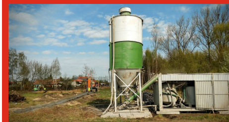
Prace przygotowawcze pod budowę wiaduktu w Łochowie na DK62. Kwiecień 2020 r.