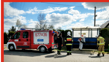
Odkażanie wiat przystankowych w Gminie Łochów. (OSP Laski) Kwiecień 2020 r.