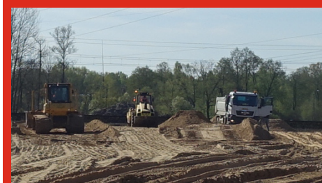
Prace przy budowie wiaduktu. Jasiorówka - maj 2020 r.