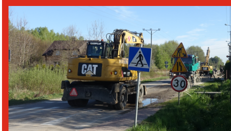
Budowa kanalizacji sanitarnej na ulicy Nowowiejskiej. Łochów - maj 2020 r.