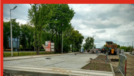
„Parkuj i jedź” Trwają prace przy budowie parkingu w Łochowie. Czerwiec 2020 r.