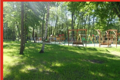
Otwarcie placów zabaw w Gminie Łochów. Park „Dębinka” w Łochowie. Czerwiec 2020 r.