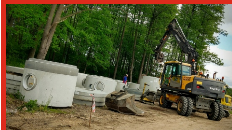
Rozpoczęcie prac przy budowie ulicy Sosnowej w Łochowie. Czerwiec 2020 r.