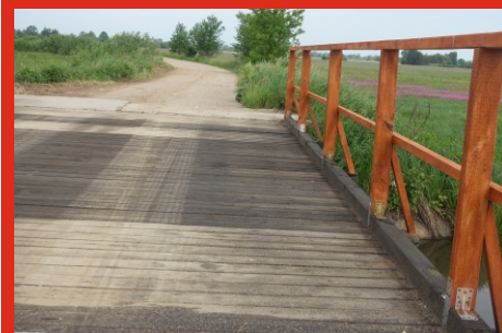
Remont mostu na rzece Ugoszcz we wsi Brzuza. Czerwiec 2020 r.