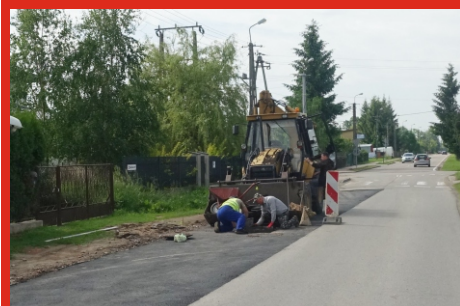
Zakończenie prac przy budowie kanalizacji na ul. Nowowiejskiej w Łochowie. Czerwiec 2020 r.