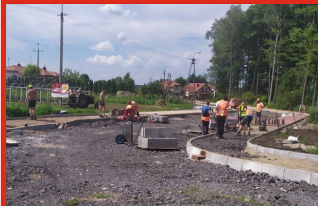
Budowa ulicy Sosnowej w Łochowie. Lipiec 2020 r.