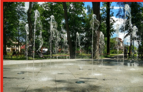
Fontanna w parku „Dębinka”. Sierpień 2020 r.