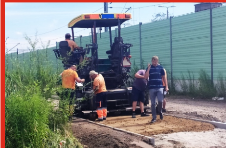
Budowa ścieżki rowerowej wzdłuż ul. Dolnej. Lipiec 2020 r.