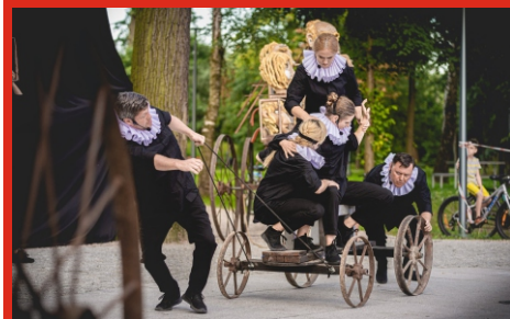
Spektakl „Burza” W. Szekspira. Teatr „MAKATA” Łochów - Park „Dębinka”. Lipiec 2020 r.