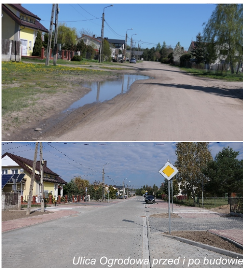
Ulica Ogrodowa przed i po budowie

drogi w Baczkach. Na ukończeniu są roboty na drodze powiatowej w Barchowie. Dzięki tym działaniom w ciągu ostatniego roku powstało sześć nowych odcinków drogowych, a na kolejne szykujemy wnioski i dokumentację projektową. Wybudowaliśmy też sieć wodociagową we wsi Łazy i kanał deszczowy odwadniający osiedle przy ul. Węgrowskiej. To inwestycja od lat wyczekiwana przez mieszkańców, ponieważ przy opadach deszczu często w tym miejscu dochodziło do zalania nieruchomości. Zazwyczaj taka akcja kończyła się interwencją straży pożarnej, która wypompowywała wodę do pobliskiego rowu. Mam nadzieję, że dzięki tej inwestycji taka sytuacja już nigdy więcej się nie powtórzy. Zrealizowaliśmy też wiele zadań na terenach wiejskich, często ze wsparciem z Mazowieckiego Instrumentu Aktywizacji Sołectw. Dzięki temu powstały m.in.: place zabaw i ich ogrodzenia, siłownia napowietrzna, wiaty przystankowe i kolejne odcinki oświetlenia drogowego.