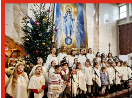
Koncert kolęd w Kościele pw. Niepokalanego Serca NMP w Łochowie. 6 stycznia 2022 r.