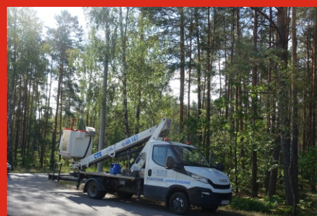
Rozbudowa oświetlenia drogowego drogi gminnej Jertzyska - Łosiewice. Sierpień 2020 r.