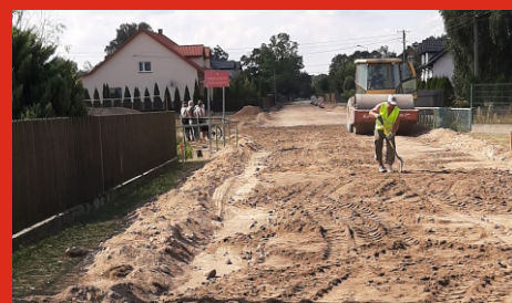
Przebudowa drogi gminnej w Laskach. Sierpień 2020 r.