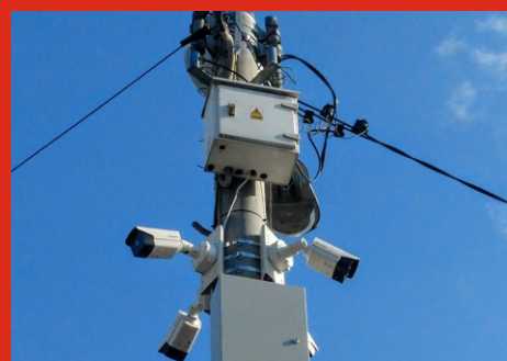
Instalacja monitoringu miejskiego w Łochowie. Sierpień 2020 r.