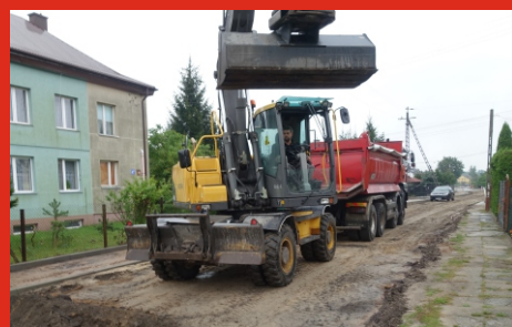
Rozbudowa ulicy Zwycięstwa w Ostrówku. Sierpień 2020 r.