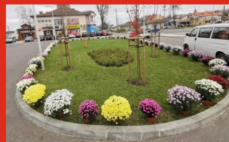
Zatoka autobusowa w Łochowie. Listopad 2020 r.