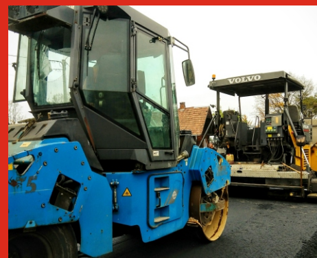
Budowa drogi w Jasiorówce. Listopad 2020 r.