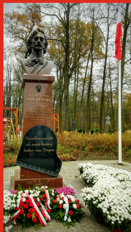
Pomnik I.J. Paderewskiego. Park „Dębinka”, listopad 2020 r.