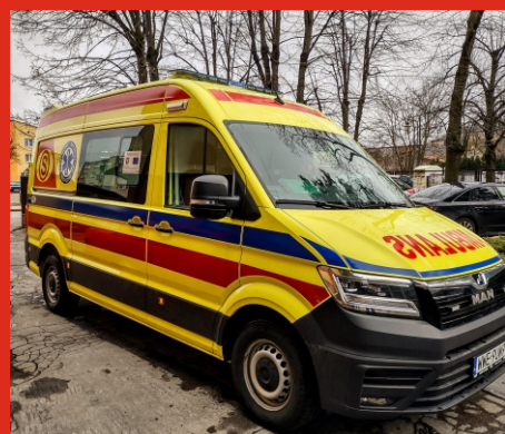
Nowa karetka SPZOZ Węgrów do służby w Gminie Łochów. Luty 2022 r.