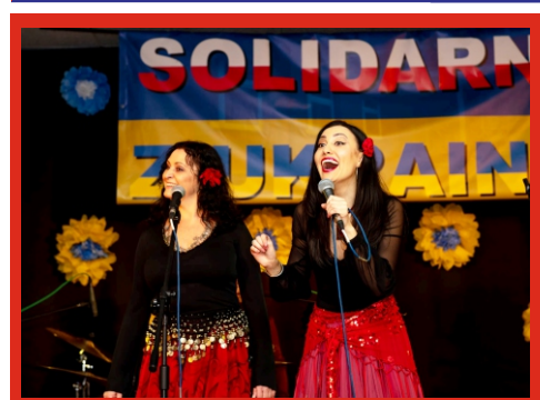
Koncert „Kobiety kobietom” z okazji Dnia Kobiet w MiGOK Łochów. 8 marca 2022 r.