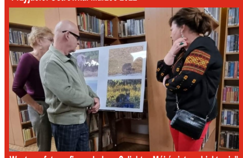
Wystawa fotograficzna Lubow Szlichty „Mój świat w obiektywie”. Biblioteka Publiczna w Łochowie. Marzec 2022