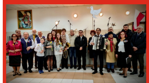
Solidarni z Ukrainą. Koncert słowno-muzyczny połączony ze zbiórką darów, zorganizowany przez Stowarzyszenie Przyjaciół Ostrówka. Marzec 2022