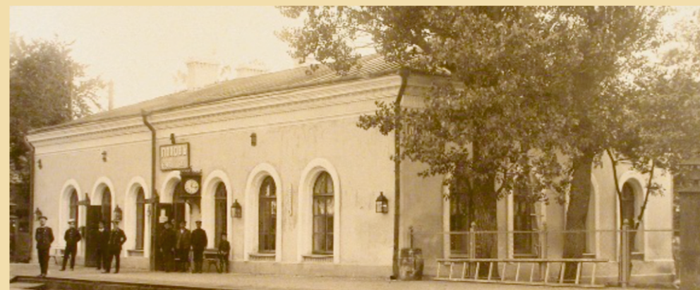
Stacja kolejowa Łochów. Lata 1900-1915,

źródło: „Путешествие по Петербурго-Варшавской железной дороге. Часть 3. От Вильны до Варшавы”