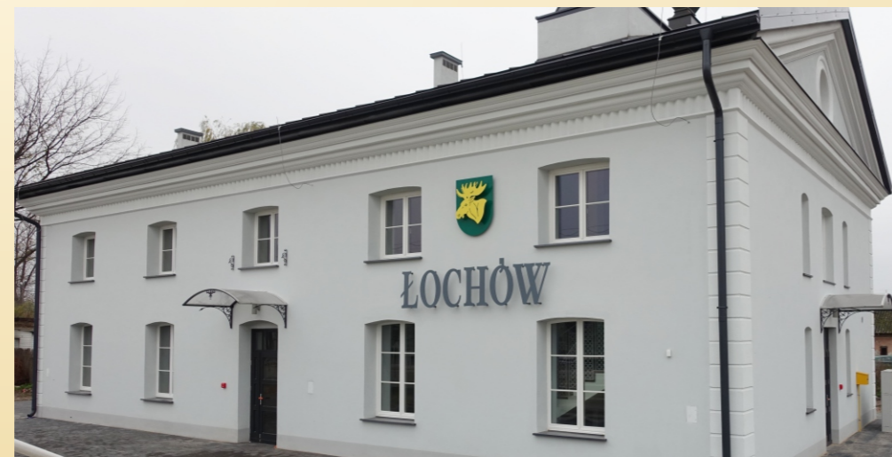
Budynek Dworca Kolejowego w Łochowie. Listopad 2017 r.