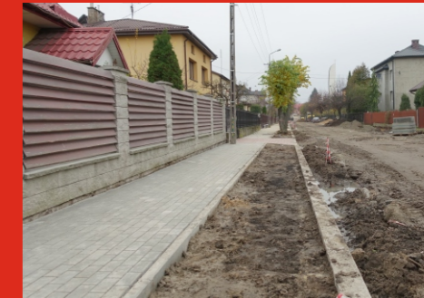
Przebudowa ulicy Chopina w Łochowie