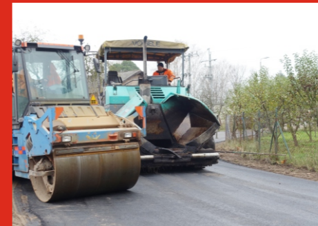
Nawierzchnia asfaltowa w Samotrzasku