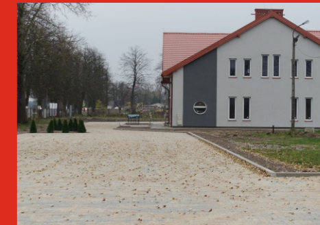
Parking przy boisku ŁKS