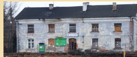
Budynek dworca kolejowego w Łochowie. 2014 rok.

Splonęła wieża ciśnień a zburzony dworzec kolejowy nie nadawał się do odbudowy. Obecny budynek dworca PKP powstał w latach czterdziestych XX wieku poprzez adaptację budynku wzniesionej w 1868 roku parowozowni, jako jeden