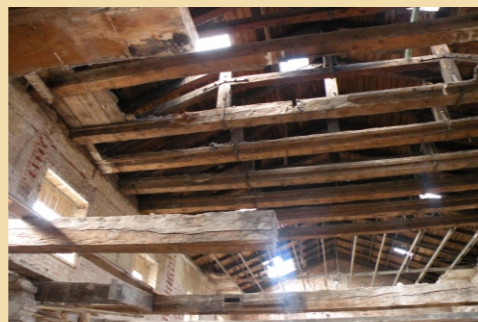
Wnętrze dworca kolejowego podczas remontu. 2016 rok.

W latach 2015-2017 Gmina Łochów przeprowadziła gruntowny remont budynku dworca, ze środków własnych, w ramach zadania w budżecie „Rewitalizacja budynku dworca kolejowego w Łochowie wraz z najbliższym