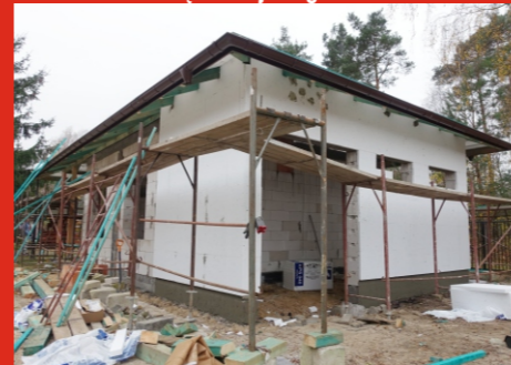
Budowa suszarni w Domu Pomocy Społecznej w Ostrówku