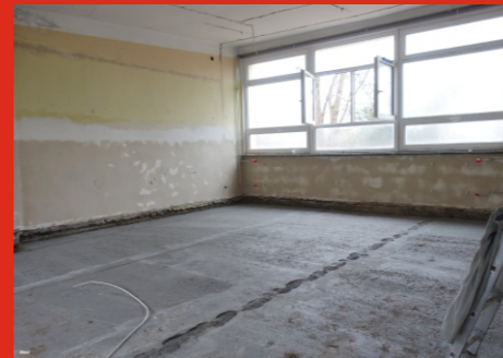
Adaptacja pomieszczeń byłej szkoły w Łosiewiczach na archiwum Urzędu Miejskiego w Łochowie