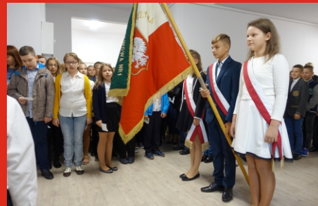
4 września 2017 r. Rozpoczęcie roku szkolnego w Szkole Podstawowej Nr 1 im. Baonu Nadbuziańskiego Armii Krajowej.