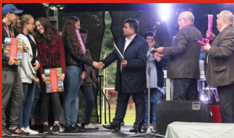
2 września 2017 r. Festyn Pożegnanie Lata w Ostrówku. Wręczenie nagród laureatom konkursu wiedzy o Gminie Łochów.