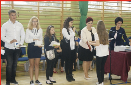
4 września 2017 r. Rozpoczęcie roku szkolnego w Szkole Podstawowej z Oddziałami Gimnazjalnymi im. Henryka Sienkiewicza w Kamionnie.