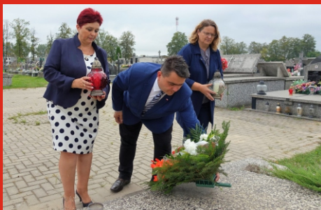
1 września 2017 r. Złożenie kwiatów pod pomnikiem Poległych i Pomordowanych w XX w. za wolną i niepodległą Polskę przez delegację Urzędu Miejskiego w Łochowie