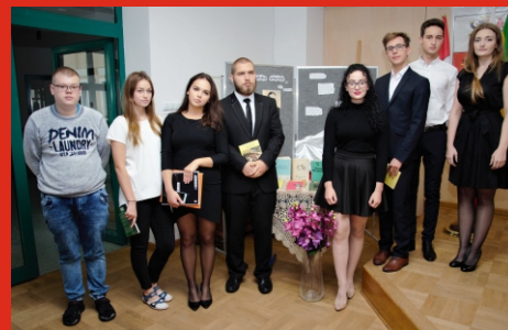
7. września 2017 r. Narodowe czytanie „Wesela” Stanisława Wyspiańskiego. Sala Konferencyjna ZSP Łochów.