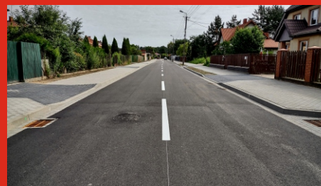
Przebudowana ul. Sadowa w Łochowie.