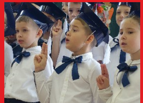
Pasowanie Pierwszaków ze Szkoły Podst. Nr 3 w Łochowie.