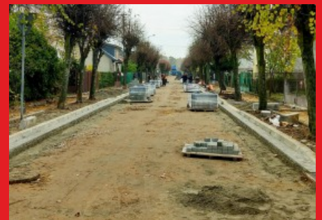
Przebudowa ulicy Mickiewicza w Łochowie. Listopad 2019 r.