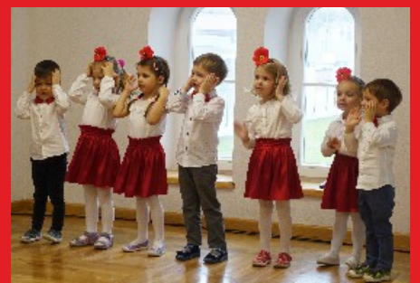
Występ dzieci z Samorządowego Przedszkola w Łochowie. Dzień Edukacji Narodowej. Sala konferencyjna DK w Łochowie.