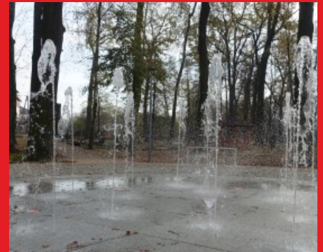
Próba fontanny w parku „Dębinka” w Łochowie.