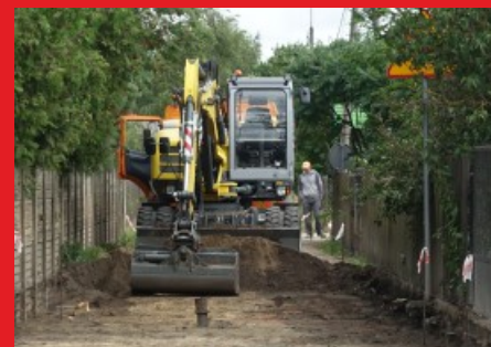
Budowa łącznika między drogą Budziska - Jasiorówka a DK 62 - Lipiec 2019 r.