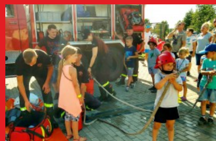
Festyn Rodzinny w Matalach zorganizowany przez Koło Gospodyń Wiejskich i Radę Sołecką. 30.06.2019 r.