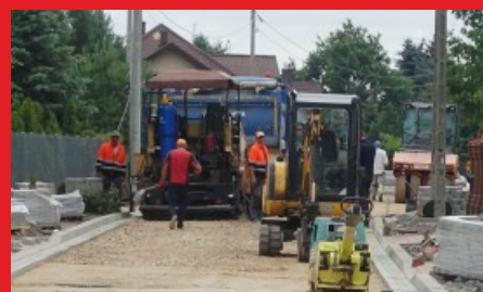
Przebudowa ul. Chopina w Łochowie - Lipiec 2019 r.