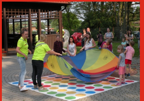
Dzień Dziecka w Łazach, organizowany z Funduszu Sołeckiego. Czerwiec 2019 r.