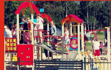
Otwarta Strefa aktywności w Szkole Podstawowej Nr 2. Czerwiec 2019 r.