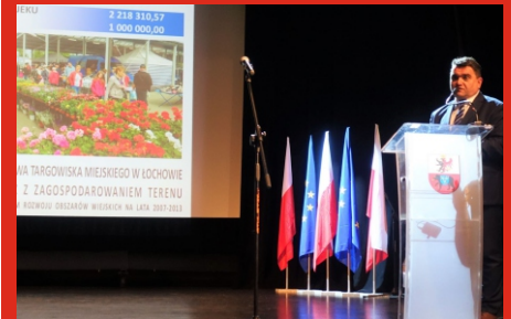
Konferencja „15 lecie Powiatu Węgrowskiego w Unii Europejskiej”. 14 maja 2019 r.