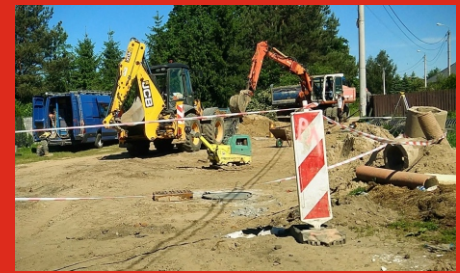
Przebudowa ul. Chopina w Łochowie. Czerwiec 2019 r.