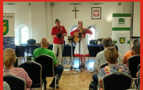
38 Kongres Esperantystów w Łochowie. Maj 2019 r.