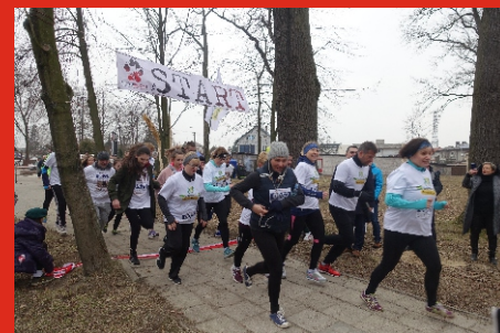
„Tropem Wilczym”. Bieg Pamięci Żołnierzy Wyklętych. 3 marca 2019 r.