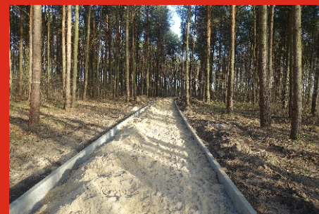
Marzec 2019. Roboty rewitalizacyjne w parku miejskim „Debinka”.