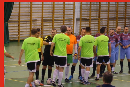
Luty 2019 r. Turniej charytatywny pod patronatem Burmistrza Łochowa „Gramy dla Eli i Dawida”.