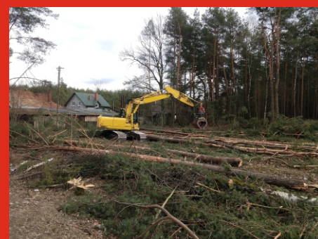
Prace przygotowawcze pod budowę wiaduktu w Zagrodnikach, w miejscu obecnego przejazdu kolejowego w Toporze.