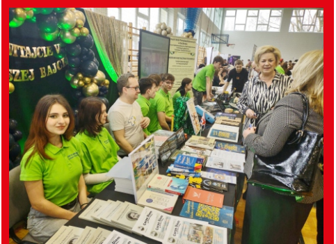
Młodzież z ZSP w Łochowie na Powiatowych Targach Szkolnych.