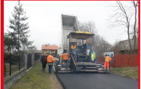
Trwa remont drogi gminnej Zambrzyniec - Matały.