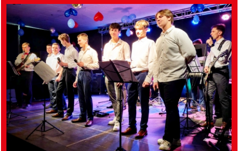
Dzień Kobiet w MiGOK. Koncert zespołu ZSP w Łochowie „Raz na jakiś czas, nie częściej niż raz w roku, zawsze na Dzień Kobiet”.