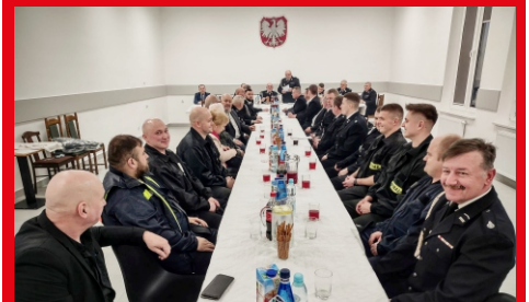
Pierwsze Walne Zebranie Sprawozdawcze OSP Brzuza w wyremontowanej remizie.