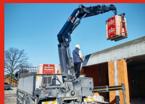
Rozbudowa świetlicy wiejskiej w Łosiewiczach. Planowane zakończenie robót - wrzesień 2025 r.