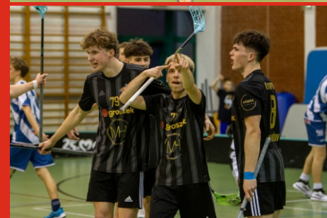
Olimpia Łochów złotym medalistą Juniorów Starszych. Sportowcy z Łochowa, w Finale Ligi U19 Juniorów, wygrali z KS Gorący Potok Szarotka Nowy Targ