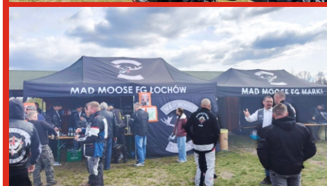
X Otwarcie Sezonu Motocyklowego Mad Moose Łochów . 12 kwietnia 2026 r.