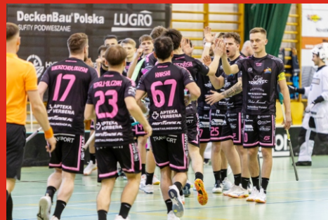
Zwycięski mecz Olimpii Łochów z Floorball Team Poznań. Drużyna z Łochowa będzie walczyła teraz o złoty medal Ekstraligi Mężczyzn z UKS Bankówka Zielonka. Kwiecień 2026 r.